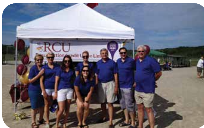
Baseball Weekend 2016, Wasaga Beach, ON