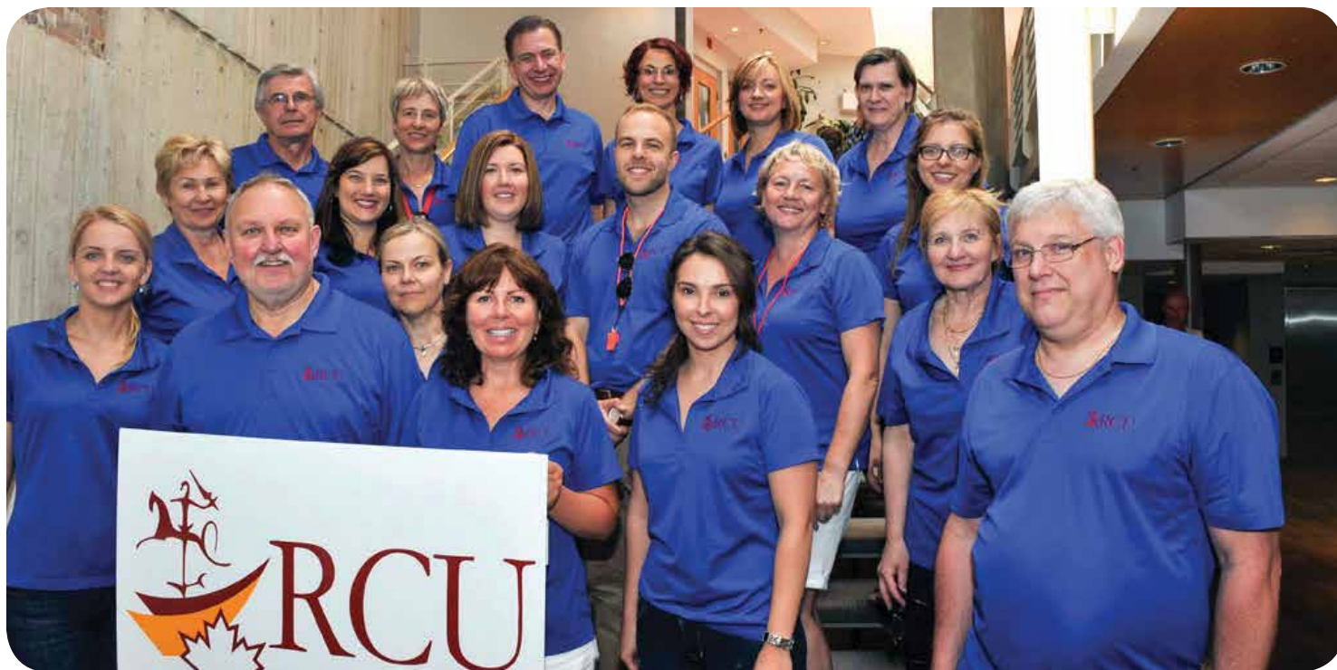
RCU Staff and Board Members at the RCU BBQ held on June 11, 2016